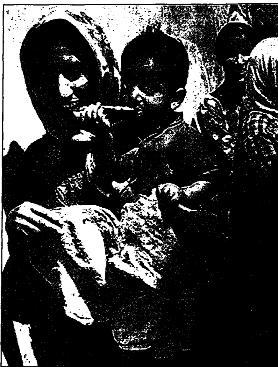
سيدة عراقية مع طفلها في بغداد

وقال رئيس مدينة الملك عبد العزيز للعلوم والتقنية صالح العثمن ان المدينة التي تضم سبعة معاهد متخصصة تقوم باجراء البحوث داخليا بهدف توفير ونقل التقنية للامانة السعودية.